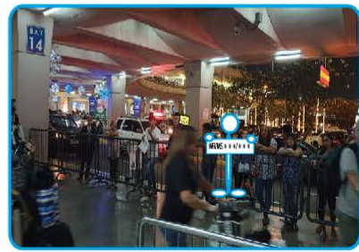
③【BAY14】の柱付近の策の外側にてコーディネーターがバーナーをお持ちして待機しております

現地連絡事務所：FRIENDSHIP TOURS & RESORTS CORP.