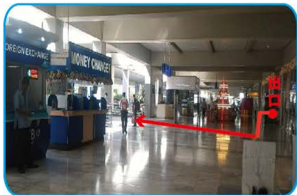
①出口を左折後、道路に向かいお進みください