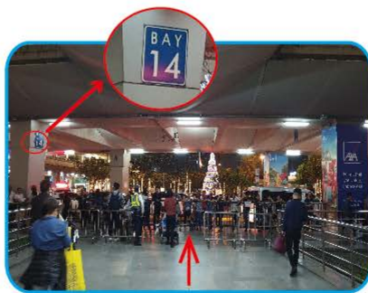
②【BAY14】と表記された柱付近までお越しください